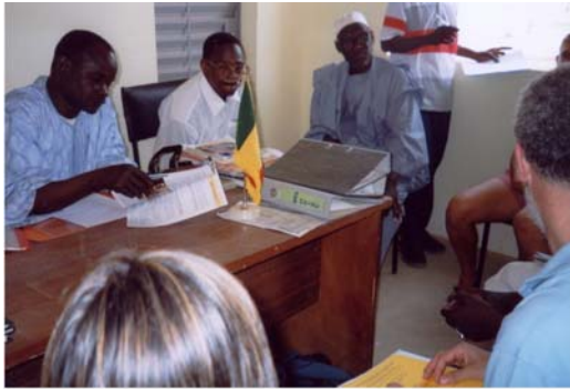
Protocols d'acord amb les autoritats i associacions del municipi d'Hombori (1) Protocolo de acuerdo con las autoridades y asociaciones del municipio de Hombori (1)