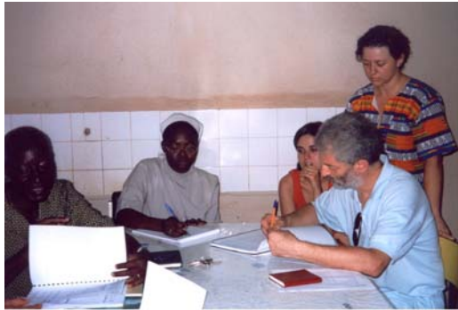
Col.laboració amb l'Orfenat Home Quisito de Ouagadougou (38) Colaboración con el Orfanato Home Quisito de Ougadougou (38)