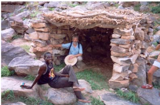
Recolzament al refugi del Coll de la Main de Fatma (27) Apoyo al refugio del Cuello de la Main de Fatma (27)