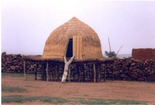
Recolzament al campament de Daari (24) Apoyo al campamento de Daari (24)