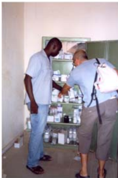
Millora del dispensari d'Hombori (7) Mejora del dispensario de Hombori (7)