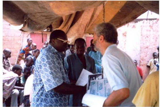
Col.laboració amb l'"Ensemble Culturel Kiswend Sida" de Ouagadougou (39) Colaboración con "Ensemble Culturel Kiswend Sida" de Ouagadougou (39)