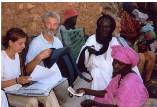
Microcrèdits a les dones de Garmi (29) Microcréditos a las mujeres de Garmi (29)