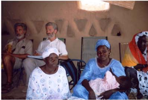
Col.laboració i recolzament a l'associació Ajikke d'Hombori (17) Col.laboración y apoyo a la asociación Ajikke de Hombori (17)