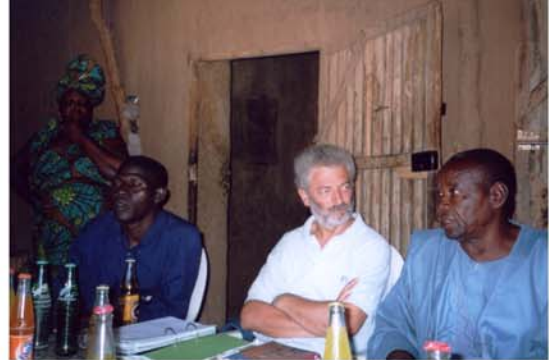
Col.laboració i recolzament a la Unió de Botiguers d'Hombori (15) Colaboración y apoyo a la "Unión de botiguers" de Hombori (15)