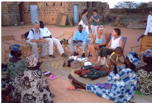
Curssets primers auxilis a dones de Garmi, Daari i Coylé amb el suport de l'hospital d'hombori (22) Cursillos primeros auxilios a mujeres de Garmi, Darri y Goylé con el apoyo de el hospital de Hombori (22)