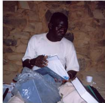
Recolzament per a la creació d'un taller fotogràfic a Hombori (18) Apoyo para la creación de un taller fotográfico en Hombori (18)