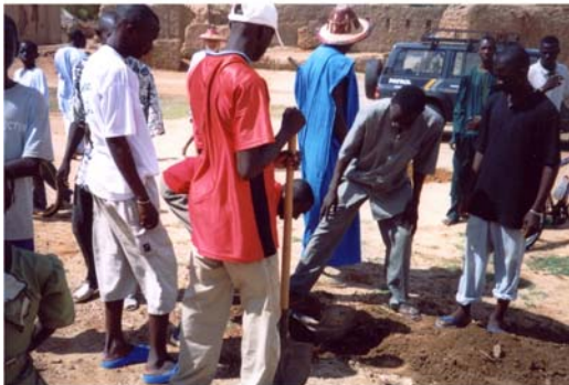
Reforestació a Hombori (9) Reforestación en Hombori (9)