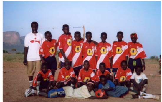
Recolzament equips de Futbol de Garmi, Daari i Hombori (12) Apoyo a equipos de Futbol de Garmi, Daari y Hombori (12)