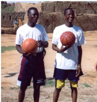
Recolzament equips de Basquet a Hombori (13) Apoyo a equipos de Basquet en Hombori (13)