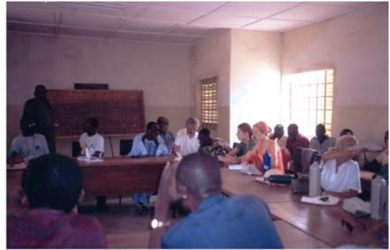
Relacions amb l'Ajuntament i amb el Subperfecte d'Hombori (2) Relaciones con el Ayuntamiento y con el Subperfecto de Hombori (2)