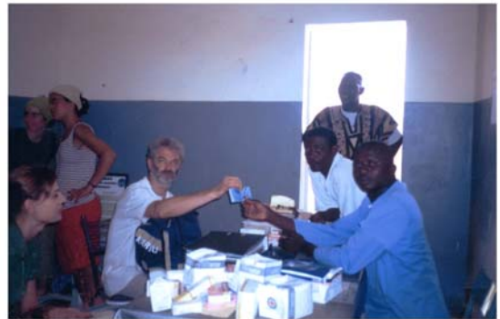
Col.laboració amb l'hospital d'Hombori (8) Colaboración con el hospital de Hombori (8)