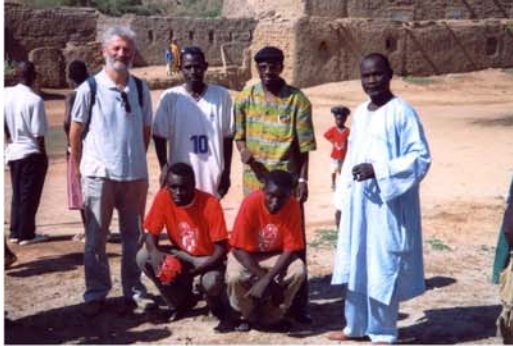
Recolzament d'equips d' Handball a Hombori (13b) Apoyo de equipos de Handball en Hombori (13b)