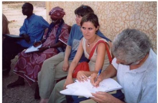
Alfabetització i escolarització a Garmi i Daari (28) Alfabetización y escolarización en Garmi y Daari (28)