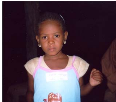
Treballs relacionats amb el manteniment dels apadrinaments a Garmi i Daari (36) Trabajos relacionados con el mantenimiento de los apadrinamientos en Garmi y Daari (36)