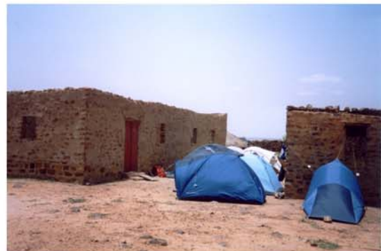
Recolzament al campament Sant Sadurní a la Main de Fatma (23) Apoyo al campamento Sant Sadurní en la Main de Fatma (23)