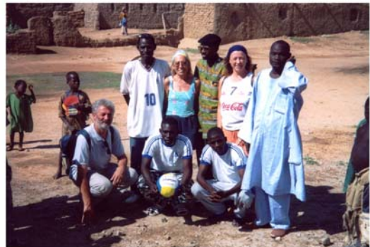
Recolzament equips de Voley a Hombori (13a) Apoyo a equipos de voley en Hombori (13a)