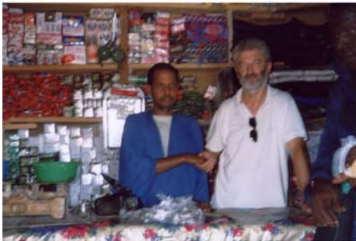
Recolzament per a la creació d'un taller òptic a Hombori (20) Apoyo para la creación de un taller óptico en Hombori (20)