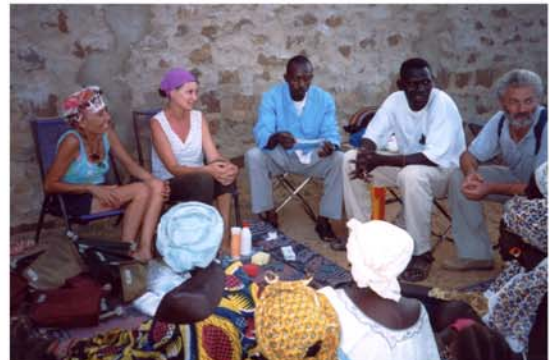
Campanya de prevenció de la Sida per a Hombori i poblats del seu municipi (21) Campaña de prevención del Sida para Hombori y poblados de su municipio (21)