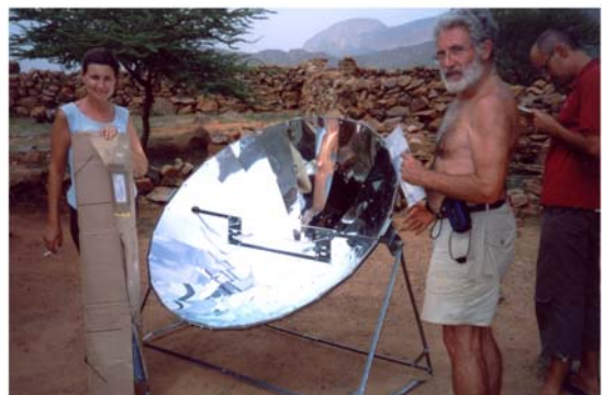
Curssets de cuina i posada en marxa de 4 cuines solars (30) Cursillos de cocina y puesta en marcha de 4 cocinas solares (30)