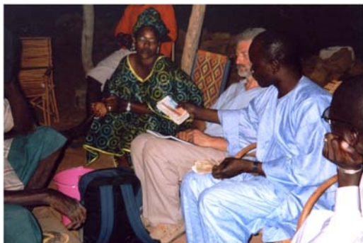
Recolzament al Banc de Cereals a Daari (31) Apoyo al Banco de Cereales en Daari (31)