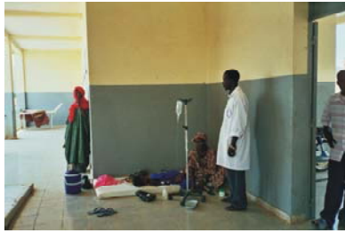
1. Colaboración con Hospital de Hombori