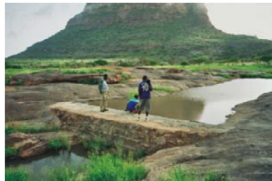
6. Presas de agua en Garmi, Mali