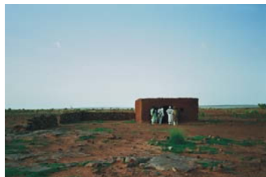
10. Banco de cereales de Daari