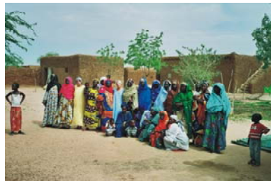
5. Colaboración y apoyo As. Ajikke de Hombori