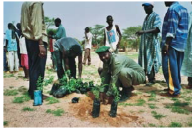
3. Reforestación en Hombori