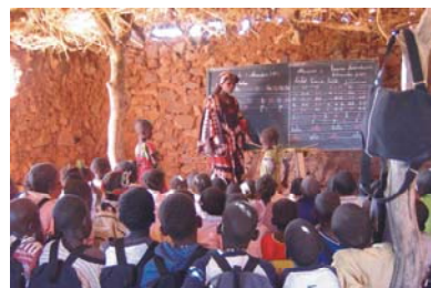
8. Alfabetización y escolarización Garmi, Daari