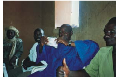
4. Colaboración con As. Comerciantes Hombori