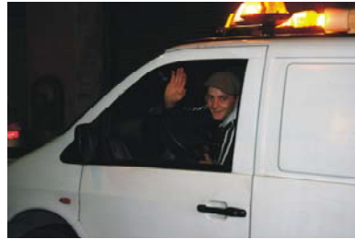
2. Colaboración con Hospital de Hombori