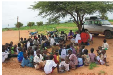
9. Alfabetización y escolarización Garmi, Daari