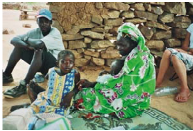
19. Brazo ortopédico