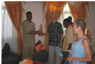
15. Ensemble culturel Kiswend Sida