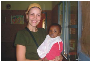
13. Orfanato Home Kisito en Ouagadougou