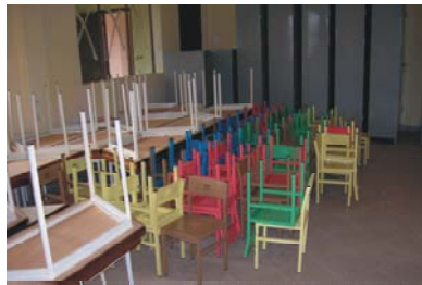
18. Proyecto Carmen en Ouagadougou