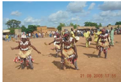
16. Ensemble culturel Kiswend Sida