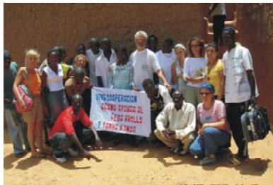
17. Asociación Tamaka Konda en Hombori