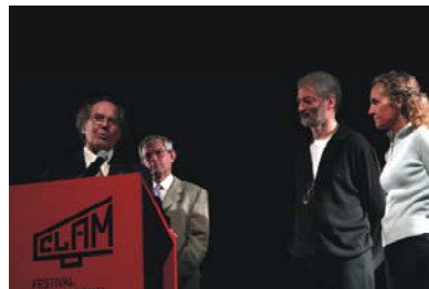
20. Premio Casaldaliga