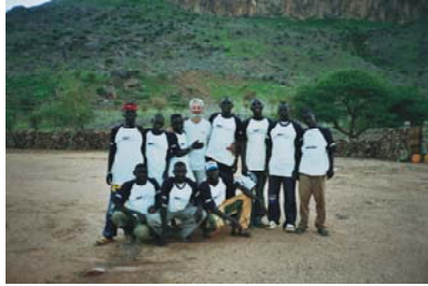
11. Guías de montaña de la Mano de Fátima