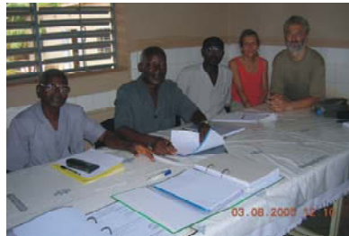
14. Orfanato Home Kisito en Ouagadougou