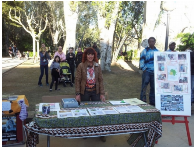
Presentación del proyecto en el festival Multikulti

✓ Festival Multikulti, punto de encuentro intercultural de las comunidades de inmigrantes que habitan en Huesca. (Abril 2013). En este festival se dio a conocer el proyecto a la población de Huesca. Se instaló un stand, en el cual se ofrecía información y se buscaban colaboradores.