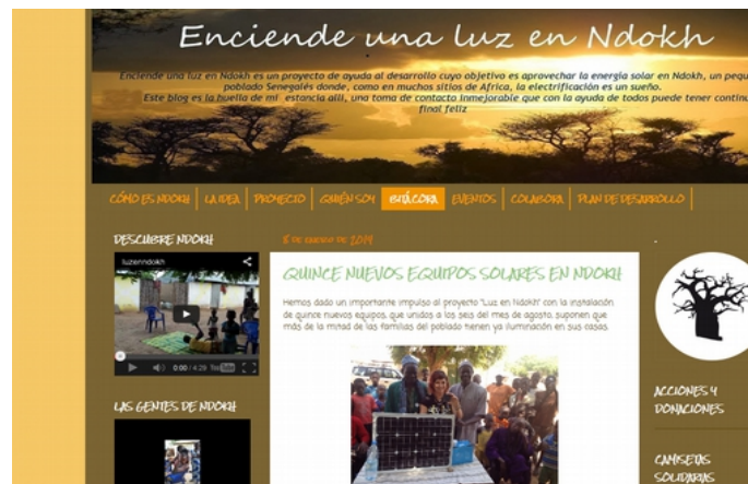
Aspecto del blog www.luzenndokh.com