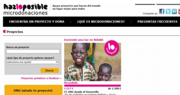
Campaña de microdonaciones